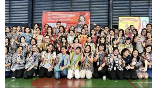
Merry Riana Gives Back for Teacher (MRGB-T)

Pada tahun 2025, Perseroan telah berkolaborasi dengan 105 sekolah di Jakarta, Tangerang, Bekasi, Pulau Jawa, dan juga luar Pulau Jawa. Total terdapat 10.464 murid berpartisipasi. Selain itu, program MRGB juga menjangkau total 940 eksekutif sebagai partisipan dari 55 institusi profesional seperti Rumah Sakit Umum Daerah (RSUD), Polisi Daerah (Polda), gereja, dan organisasi lainnya.