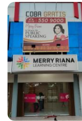
BATAM – MALL BOTANIA 2