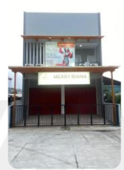
GRAND WISATA BEKASI